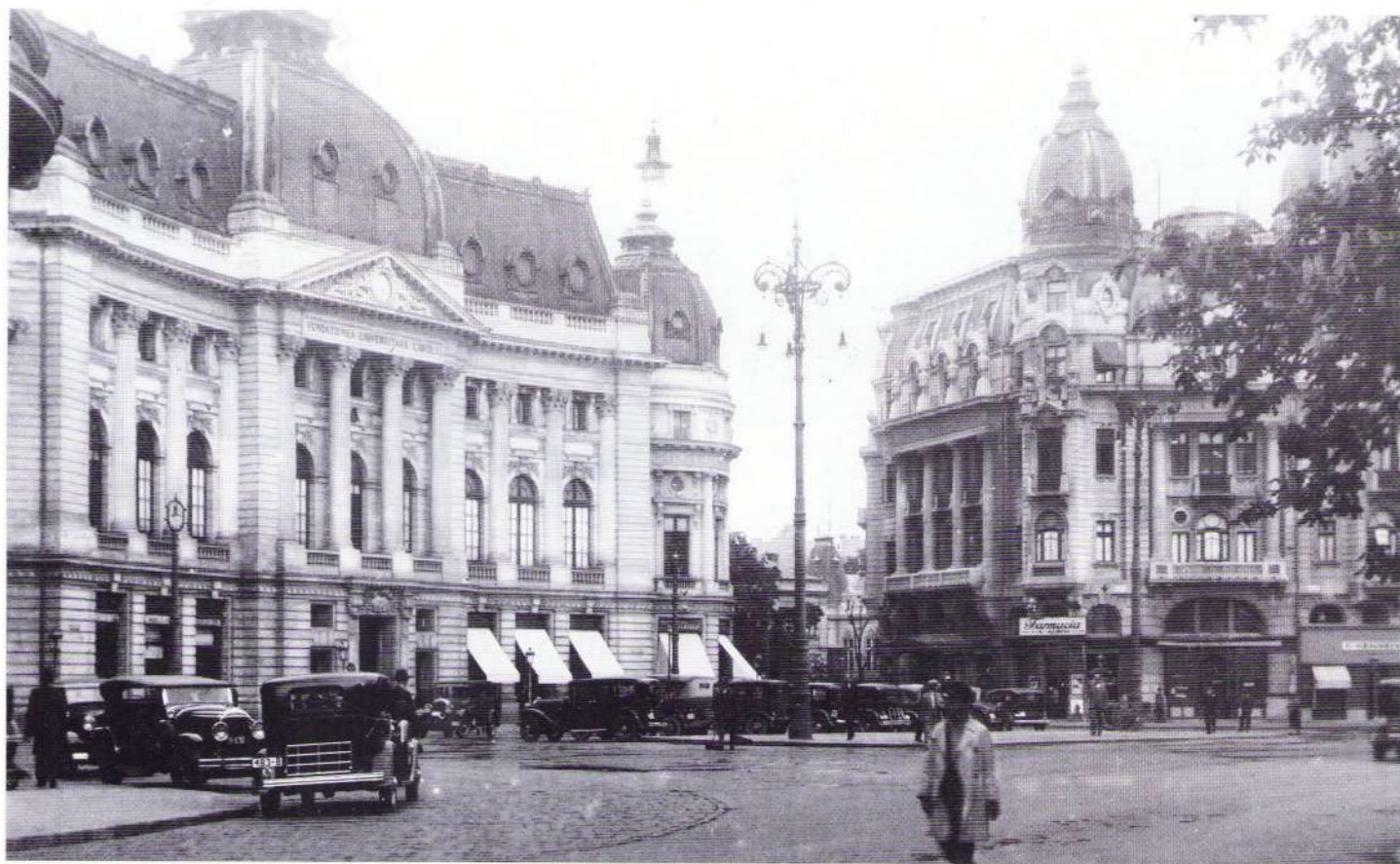
Biblioteca Centrală Universitară

Fațada edificiului este marcată, la nivelul etajelor I și II, de douăsprezece coloane adosate, dintre care patru susțin antablamentul și frontonul clădirii, deasupra căruia se află cupola centrală încadrată la extremități