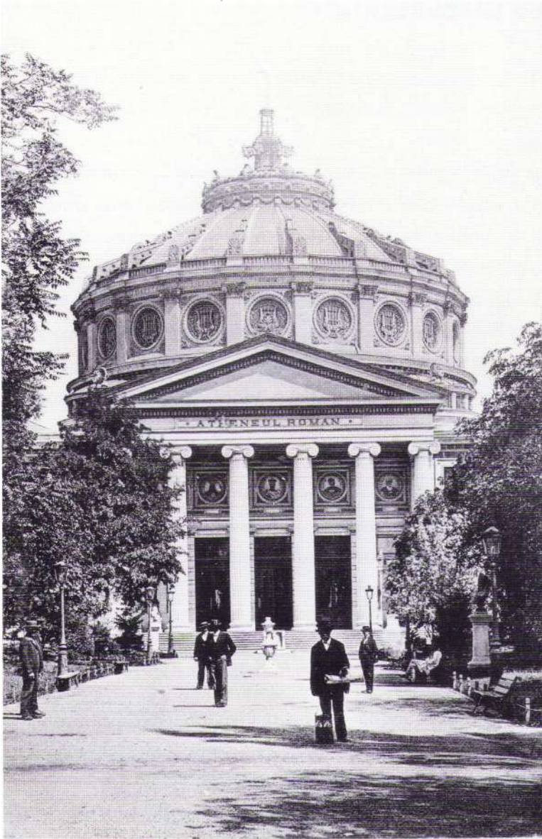
Ateneul Român (sfârșitul secolului XIX)

destinația ei - a precizat el - nu un edificiu vulgar și meschin. Să avem ambiția a construi în București un palat al științelor și al artelor în care să putem primi cu mândrie celebritățile ce ne vor vizita sau le vom chema în țara noastră. Nimic nu înalță mai mult spiritul și inima unui popor decât contemplația monumentelor care cristalizează într-însele o mare idee națională."